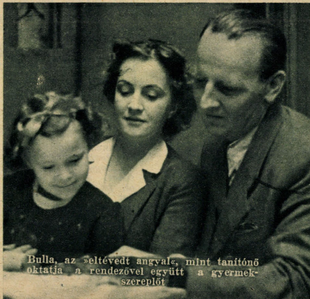
Bulla, az »eltévedt angyal«, mint tanítónő oktatja a rendezővel együtt a gyermek-szereplőt